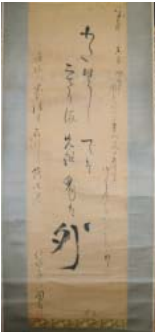
▲江戸時代の歌舞伎役者・七代目市川團十郎の掛軸

江戸時代から近現代に活躍した多彩な文化人の中から、江東地域ゆかりの人物54人を取り上げ、その遺墨を展示しています。深川を活動拠点にした芭蕉をはじめ、杉山杉風、仏頂禪師、