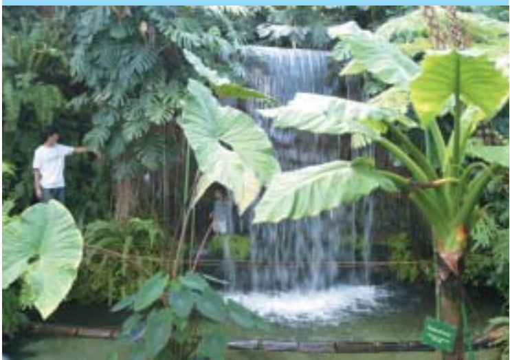
▲さまざまな熱帯・亜熱帯の植物が生い茂る「夢の島熱帯植物館」

「水」をキーワードに設定した各スポットを巡り、体感するツアーです。親子で夏休みの思い出作りに、区の魅力の一端を感じてください。参加者の方にはアンケートをお願いし、観光を