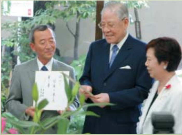
▲山崎区長と俳句交換する李登輝台湾前総統

5月31日に台湾の李登輝前総統が、芭蕉記念館に来館しました。李前総統は、「奥の細道」ゆかりの地を巡るため、奥の細道のスタート地点深川を来訪。芭蕉記念館では、芭蕉直筆の書簡や、元禄初版本「おくの細道」、芭蕉が愛好していたと伝えられる石造りの蛙などを熱心に観賞し、同館職員の説明を興味深そうに聴き入っていました。